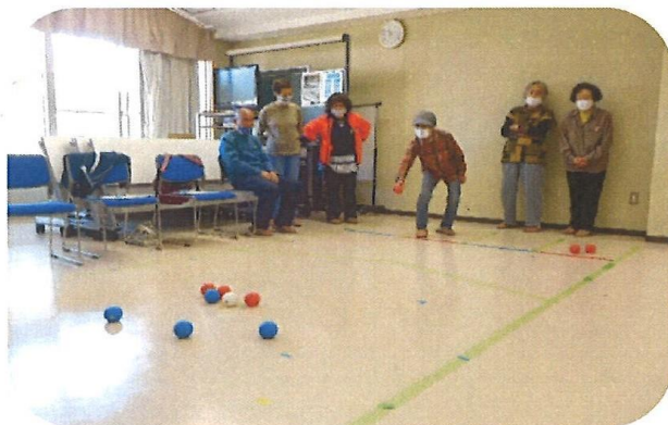
サロンでボッチャ