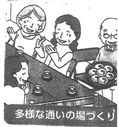
多様な通いの場づくり