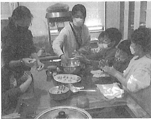
上 読み聞かせ 風景、子どもたち の目が集中する 左 4月ヨモギ 団子づくり 右 牛乳パック で外輪船づくり