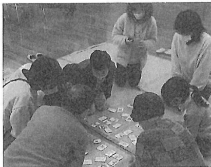
上3枚 迷路作り、万華鏡作り、クリスマスツリー作り、子ども たちの発想の豊かさに驚かされる。 左 お正月遊び（はねつき、こままわし、かるた、坊主めく り・・・）いろはかるた遊び風景。