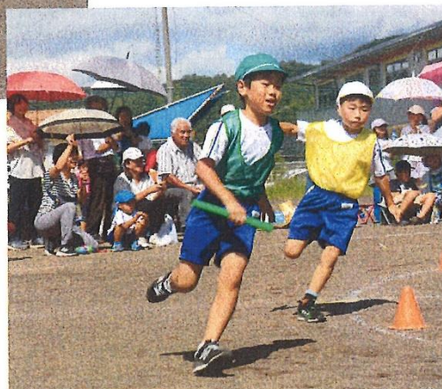
子どもたちのかわいい演技やたくましい走りを見て、活力補給