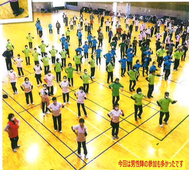
今回は男性陣の参加も多かったです