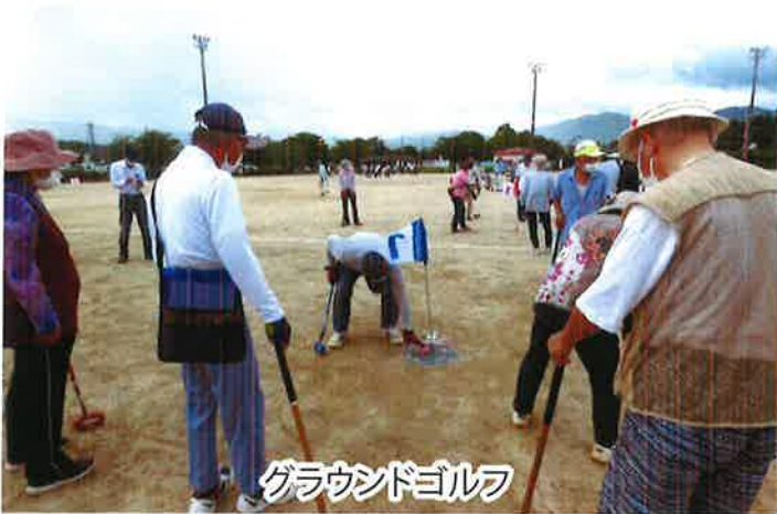
グラウンドゴルフ