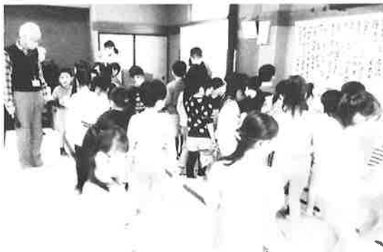
地域の子供達（年長さん）との交流会

その他の信玄餅やワイン工場などもクーポン券が使えるので、土産の袋がいっぱいになって重そうに帰ってきました。誰一人転んだりする人がいなかったのもよい旅になったと思います。（滝澤 義雄）