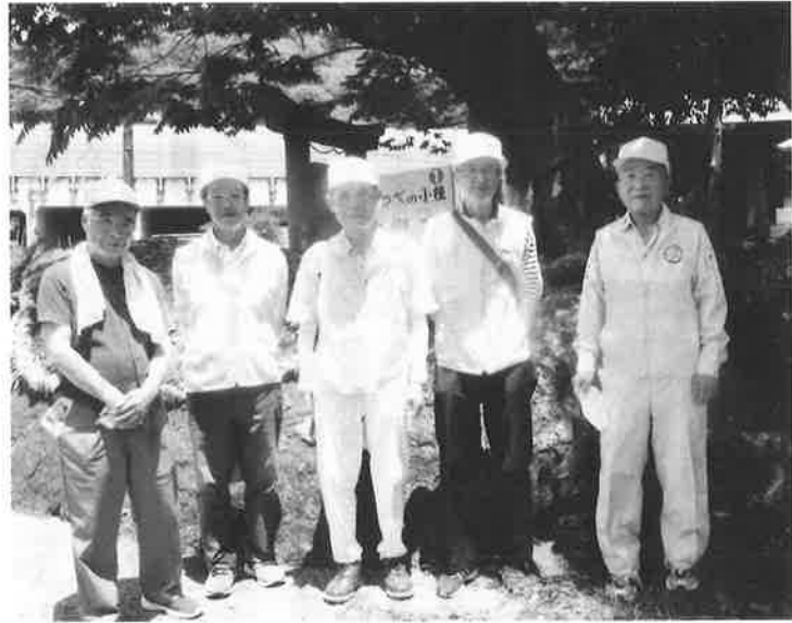
参加した役員の皆さん

6月4日(日)に、焼津市環境課・歴史民俗資料館・道路課の共催事業で開催されました。さわやかクラブやいづ連合会より5人の参加です。25人の定員のところ13人しか参加しませんでした。