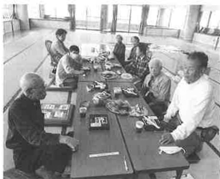
お腹を空かせ、さあご飯に。

5月には健康教室と称し、今までに無い誕生会をほほえみで開催できました。右往左往でしたが事務局の皆さん、先輩諸氏、市役所・社会福祉協議会の皆さんのご協力ありがとうございました。