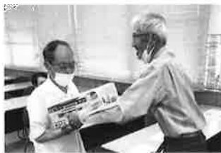
団体の部 優勝・浜友会 A

コロナの関係もあって午前と午後に分かれて実施したので、競技時間も短くゆったりとして開催できました。(滝澤 義雄)