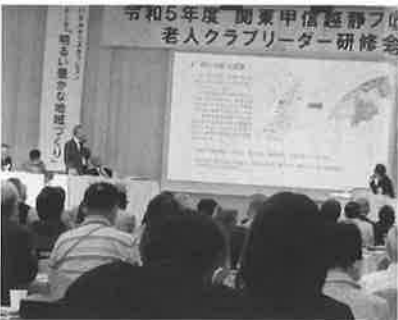
今年の関ブロは新潟市で開催。関東甲信越静から154人が集まりました。