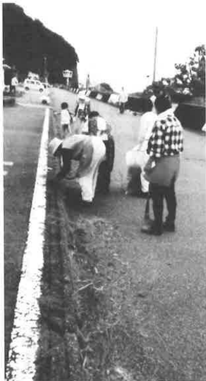
東側虚空蔵山海拔 162 m (平均海面からの高さ) 大祭 2月 23日