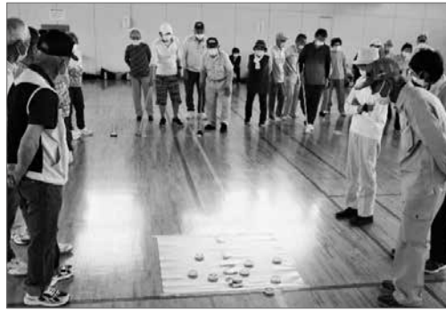
ペタボード大会の様子

静岡と浜松の中間地点、田園都市 菊川市です。前年度令和4年にあった重大なことを申し上げます。