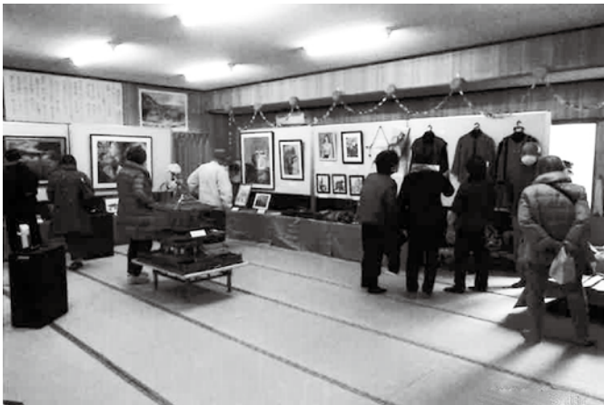
にぎわう展示会の会場

人の思わぬ特技に、誰もが感嘆の声。展示会は僅か3日間なのに町内外から合わせて100余名の方々に来観いただき、展示会の成功とともに、今年はクラブの更なる活性化が期待できそうです。