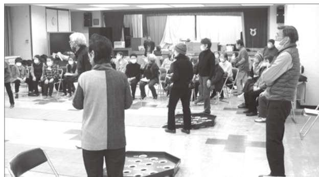
力を入れているスカットボール

当連合会の課題としては、会員数の減少、役員の担い手の不足があります。各単位クラブで会長を中心に毎年会員の勧誘を行っておりますが、非常に厳しい状況です。1人でも多くの会員が増えるよう魅力的な連合会にしていこうと日々頑張っています。