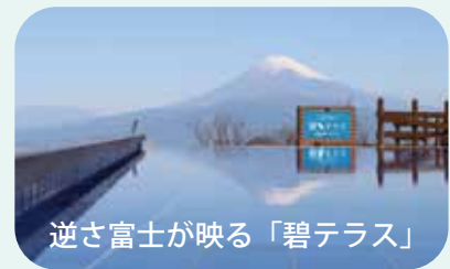
逆さ富士が映る「碧テラス」

伊豆パノラマパークは、静岡県伊豆の国市にある葛城山の山頂に広がる絶景のテラスを備えた山頂エリアと、ショップやレストランが集まる山麓の駅舎、そしてそれらを繋ぐロープウェイからなる滞在施設です。