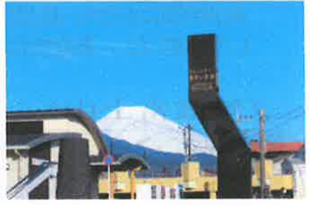
⑮コミュニティセンター