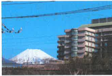
⑭県立ガンセンター