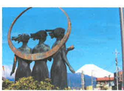
⑥コミュニティセンターより