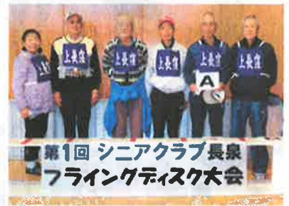
第3位:上長窪百澤クラブ A (得点:55点・最高点:9点)