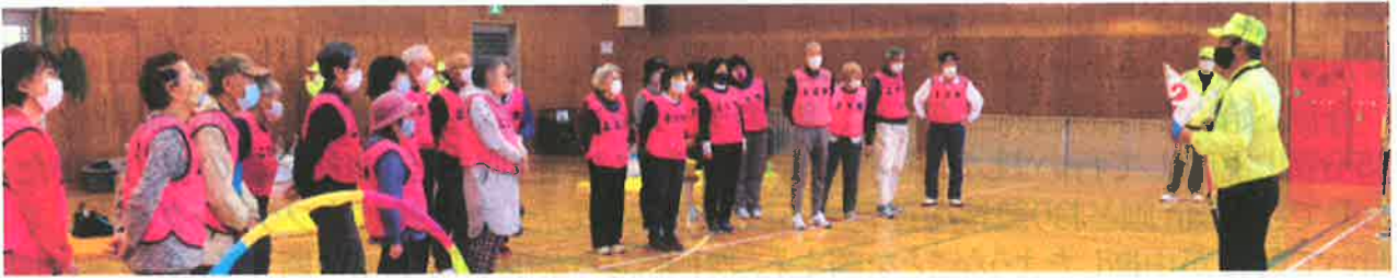
開始前の競技説明