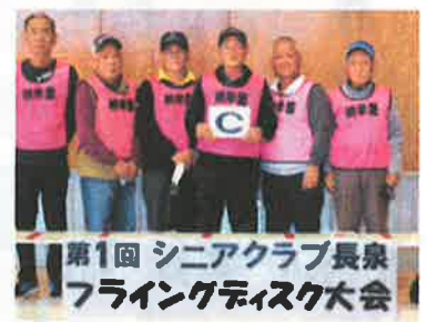
第6位:納米里シニアクラブ C (得点:51点)