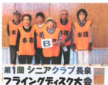
第1回 シニアクラブ長泉 フライングディスク大会 本宿B