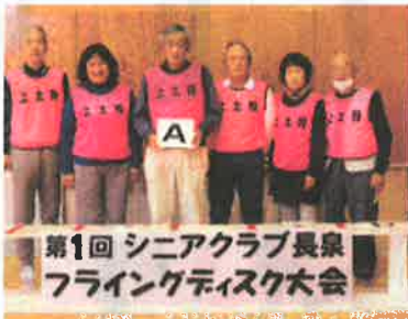
優勝:上土狩シニアクラブ A (得点:66点)