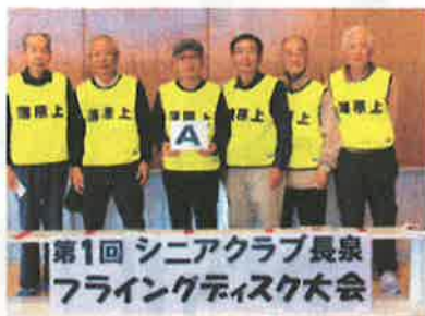
第4位:薄原上すすきの会 A (得点:55点・最高点:7点)