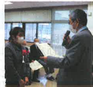
原 白寿会 山口 師子