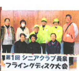
記録員スタッフの皆様