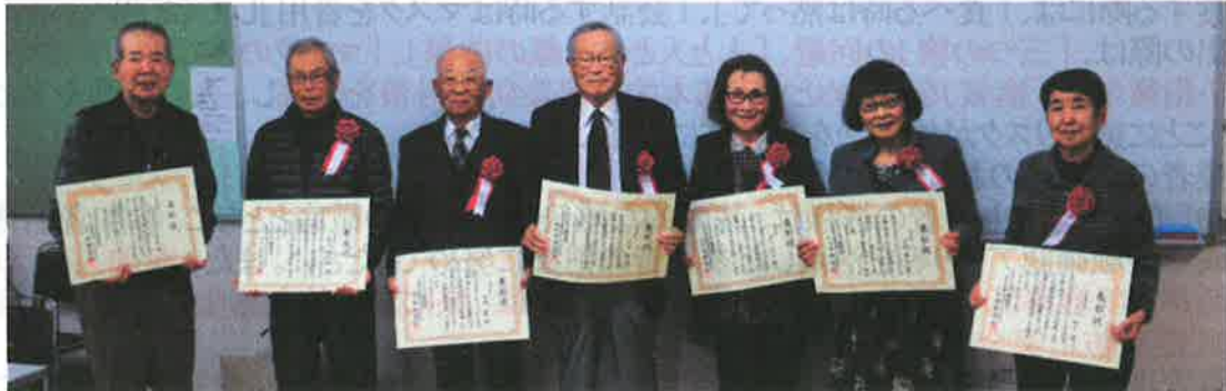
友愛活動賞 シニアクラブ竹原