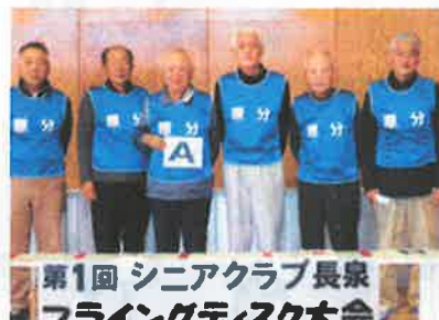
第5位:原分スマイルクラブ A (得点:53点)