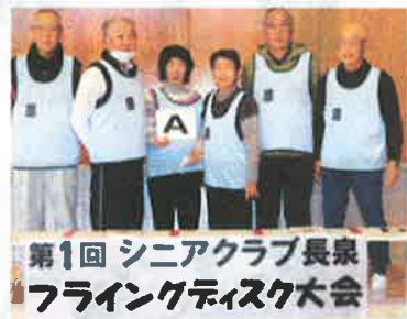
準優勝:原白寿会 A (特点:58点)