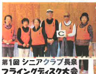
第1回 シニアクラブ長泉 フライングディスク大会 中土狩C