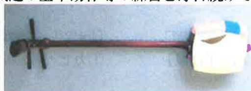
胴貼りの皮が破れた三味線

自分はこの自粛生活の中、約40年間続けていた合気道の基本動作等の練習を毎日続けて健康・精神修養の維持に努めていますが、もっと他になにかやることはないかと、25年前にやっていた三味線でもまた始めてみよう、納戸から取り出してみた所、何と胴貼りの皮が破れていて、専門店で見てもらった結果24,000円(税別)かかるとのこと。年金生活の自分にはちょっと修理は無理だ、とあきらめました。