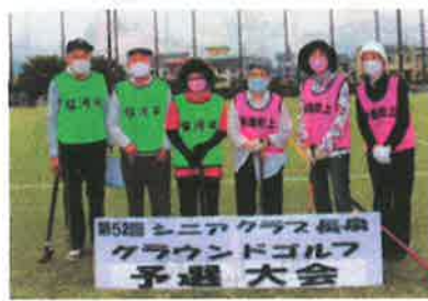
駿河平・新屋町上