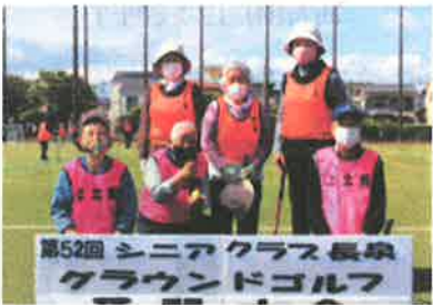
第52回 シニアクラス長泉 グラウンドゴルフ 上土狩・中土狩