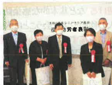
4年以上 受賞の皆さん