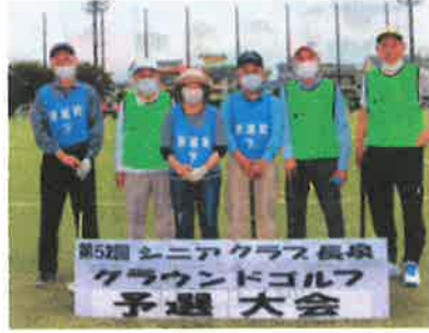
新屋町下・新屋町中