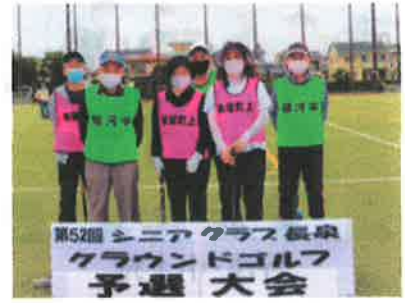
新屋町上・駿河平