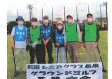
新屋町下・新屋町中