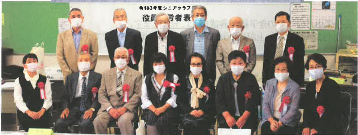
今回受賞された皆さん(出席者のみ)