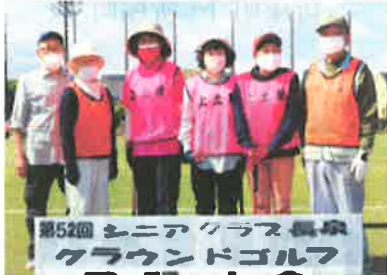
第52回 シニアクラス長泉 グラウンドゴルフ 中土狩・上土狩