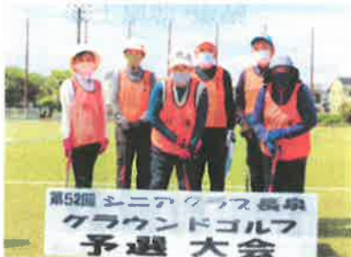
第52回 シニアクラス長泉 グラウンドゴルフ 予選 大会 谷津・中土狩