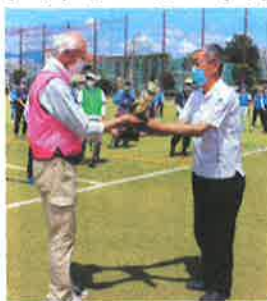
前回第三位 納米里