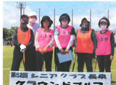
第52回 シニアクラス長泉 グラウンドゴルフ 中土狩・上土狩