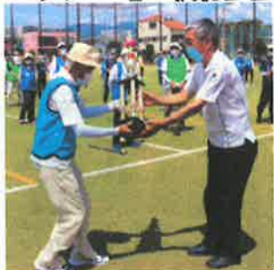
トロフィー返還:前回優勝 西