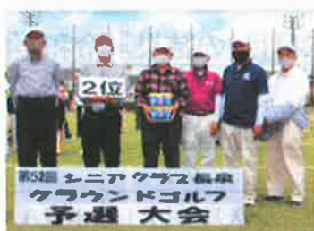
団体準優勝：下長窪