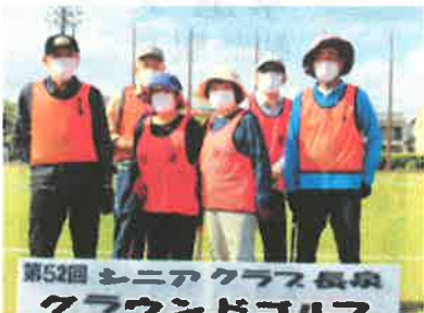
第52回 シニアクラス長泉 グラウンドゴルフ 谷津・中土狩