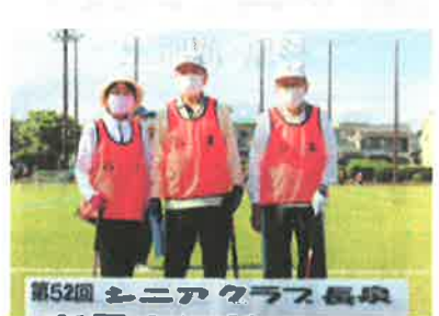
第52回 シニアクラス長泉 谷津