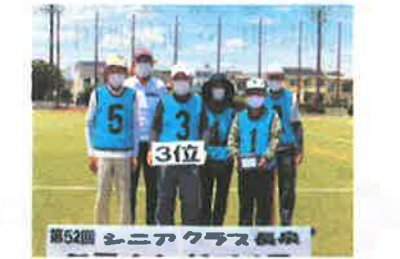
第52回 シニアクラス長泉 団体第3位:西