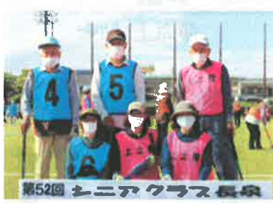
第52回 シニアクラス長泉 西・上土狩