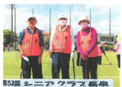
第52回 シニアクラス長泉 谷津