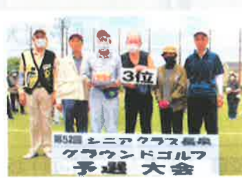
団体第三位：上長窪