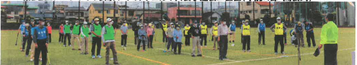
『予選大会(二日目)の結果』:令和3年5月20日開催