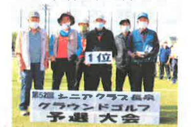
第52回 シニアクラス長泉 グラウンドゴルフ 予選 大会 団体優勝:中土狩