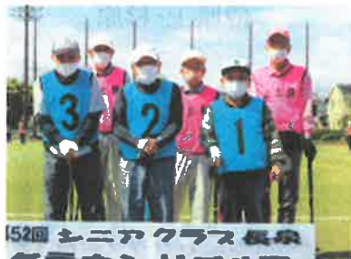
第52回 シニアクラス長泉 グラウンドゴルフ 西・上土狩