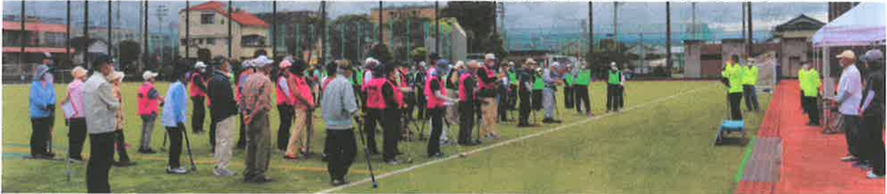
『予選大会(一日目)の結果』:令和3年5月6日開催