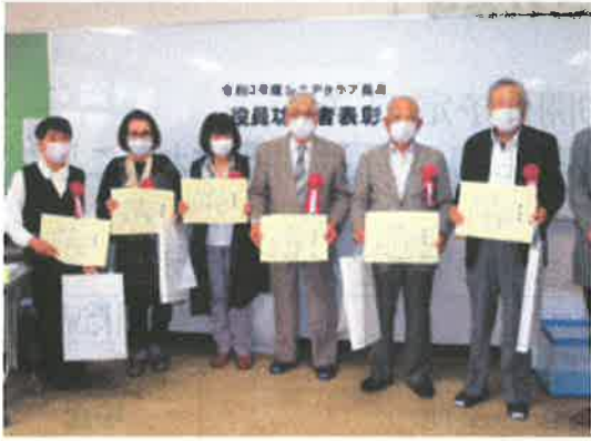
8年以上 受賞の皆さん