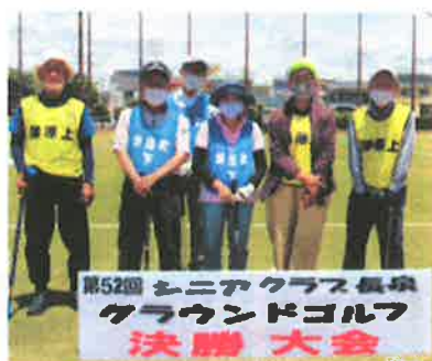
新屋町下・薄原上