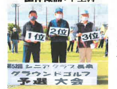
第52回 シニアクラス長泉 グラウンドゴルフ 予選 大会 男子個人賞