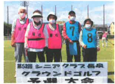
第52回 シニアクラス長泉 グラウンドゴルフ 予選 大会 屋代住宅・西