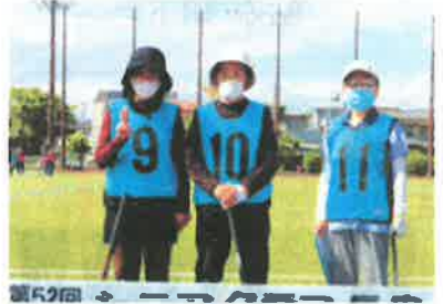
第52回 シニアクラス長泉 西