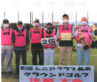
団体準優勝：納米里A