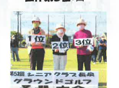
第52回 シニアクラス長泉 グラウンドゴルフ 予選 大会 女子個人賞