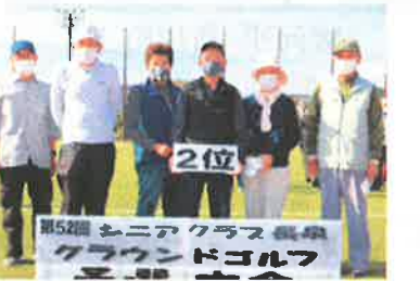
第52回 シニアクラス長泉 グラウンドゴルフ 予選 大会 団体準優勝:中土狩