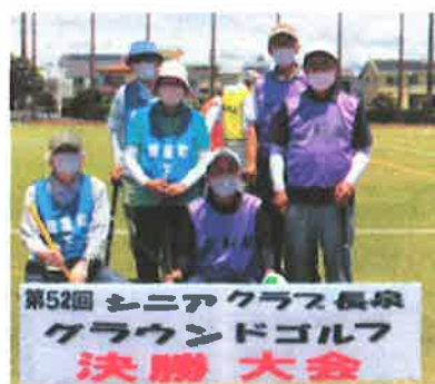
新屋町下・三軒家