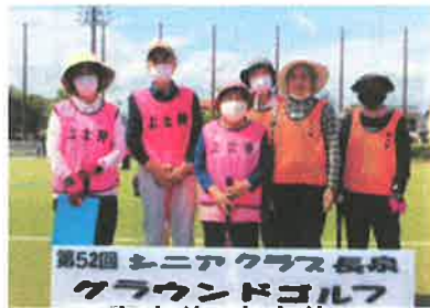
第52回 シニアクラス長泉 グラウンドゴルフ 上土狩・中土狩