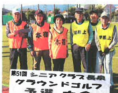
令和2年10月29日開催の第51回グラウンドゴルフ大会予選会。 他クラブの方々と一緒に、プレイします！