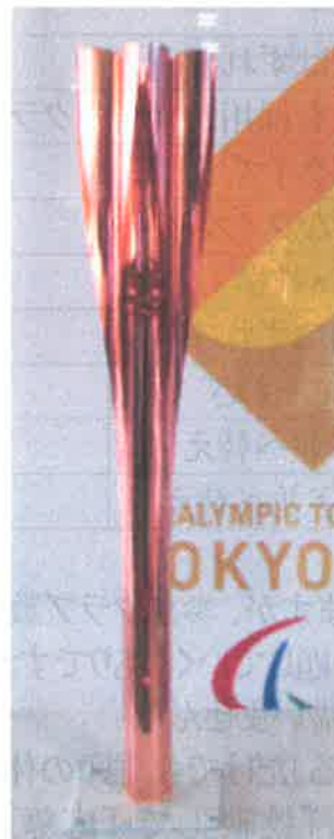
東京パラリンピックトーチ