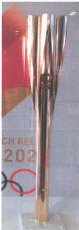
東京オリンピックトーチ

東京五輪とパラリンピックの聖火リレーで使うトーチの展示が、3月3日ウエルピアながいずみの1階ロビーに、五輪とパラリンピックの1本づつが展示されました。新型コロナウイルス感染防止のため、密の回避とマスク着用等により、見学しました。五輪の聖火リレーは、6月24日に町内の県立ガンセンターから北小学校の間を走るそうです。