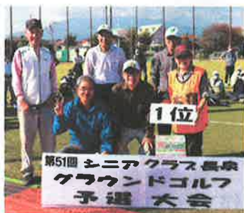
令和2年10月29日開催の 第51回グラウンドゴルフ大会予選会で 第1位となり、決勝大会に進出！！

興味をお持ちの方は、ご都合のつく日程で顔出し参加いかがですか？ 非会員の方も、ウェルカムです！！