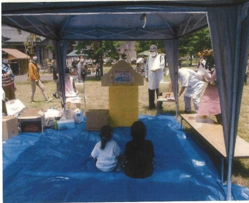
風船羽根つきは、子どもたちに大人気でした。 紙芝居は、テントのまわりにも、多くの皆さんが集まってくれました。