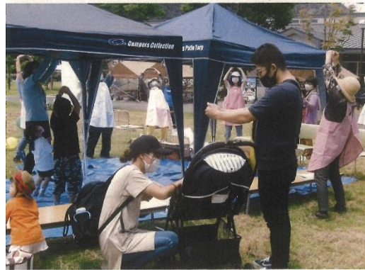
天気の良い広場でのラーメン体操は、気持ちよくのびのびと運動できました。