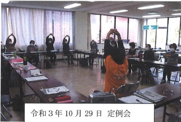
令和3年10月29日 定例会 シルバーリハビリ健康体操