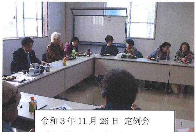
令和3年11月26日 定例会 (町長との話し合い)