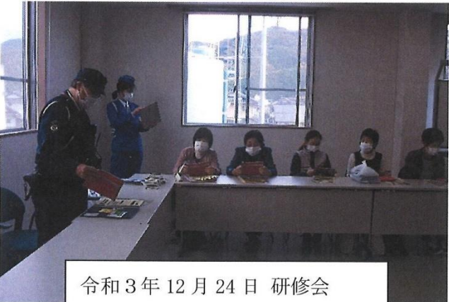
令和3年12月24日 研修会 交通安全教室