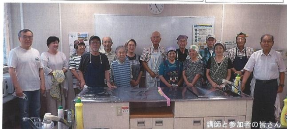
講師と参加者の皆さん