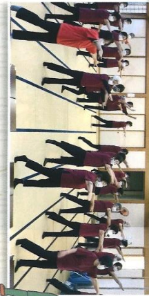
いきいき健康体操部