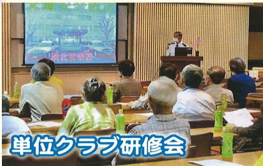
単位クラブ研修会