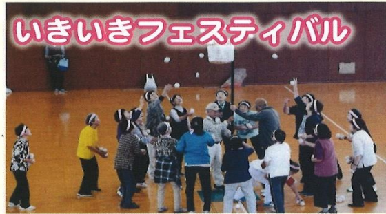
いきいきフェスティバル