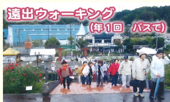
遠出ウォーキング (年1回 バスで)