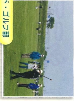
グラウンド・ゴルフ部