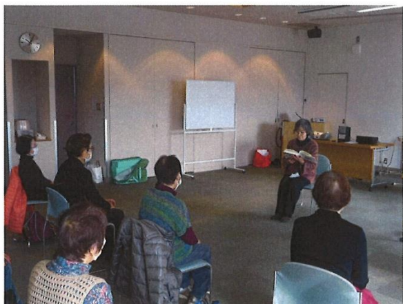
大人のための読み聞かせ