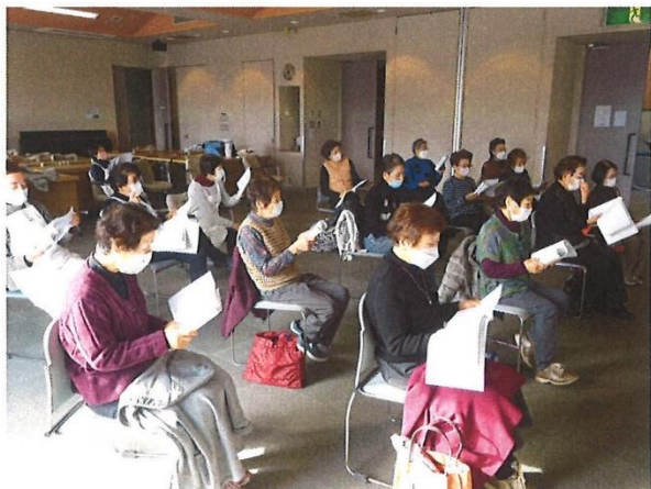
みんなで季節の歌を合唱