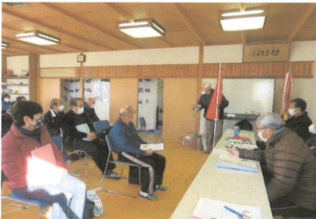
地元【徳倉城】の講義