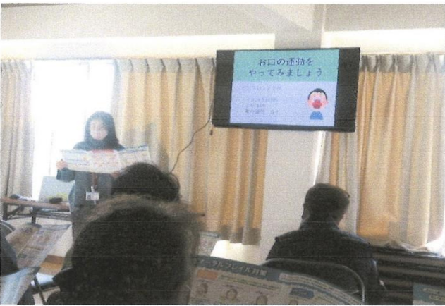
健康教室 (口腔ケアの勉強会)