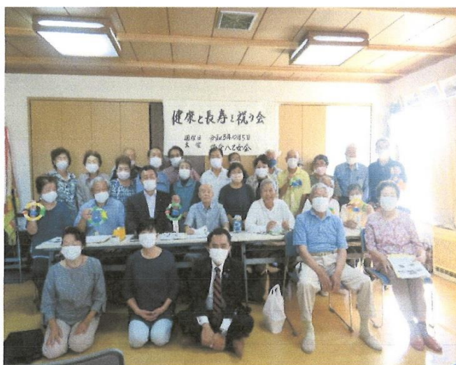
10月 健康と長寿を祝う会