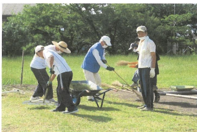
9月 グランド清掃、整備