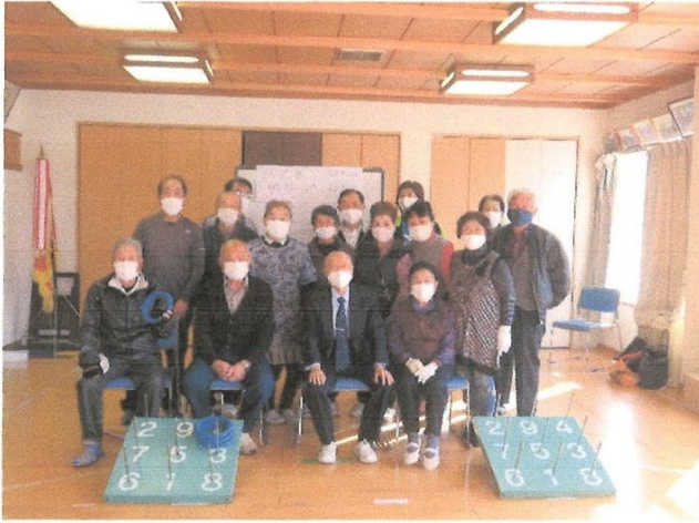
輪投げ・ポッチャ大会