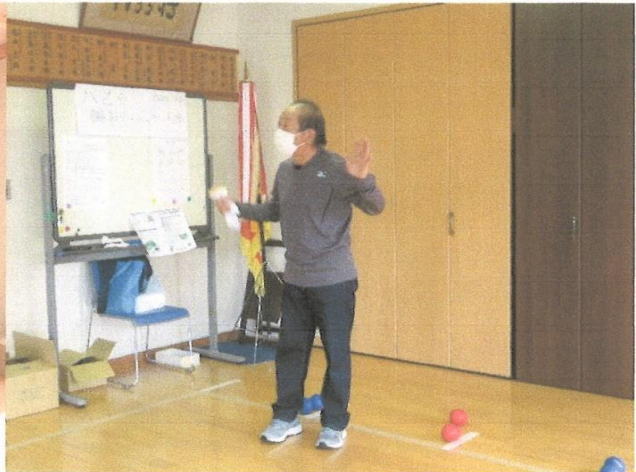
競技説明 (ポッチャ)