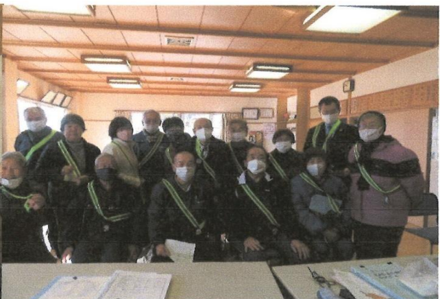
反射材タスキ、交通安全啓蒙 車には気をつけましょう。