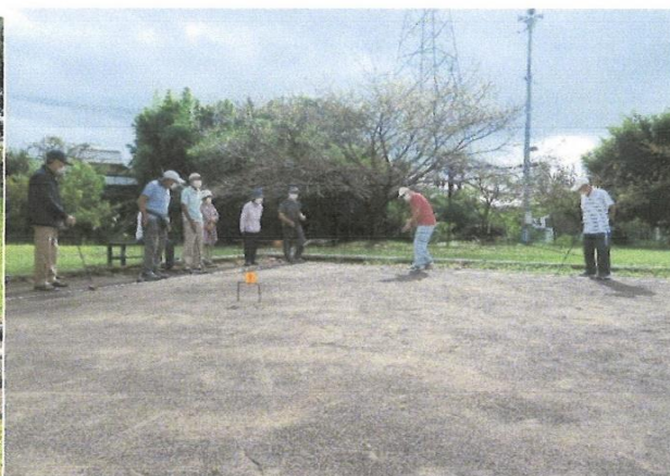
ゲートボール大会