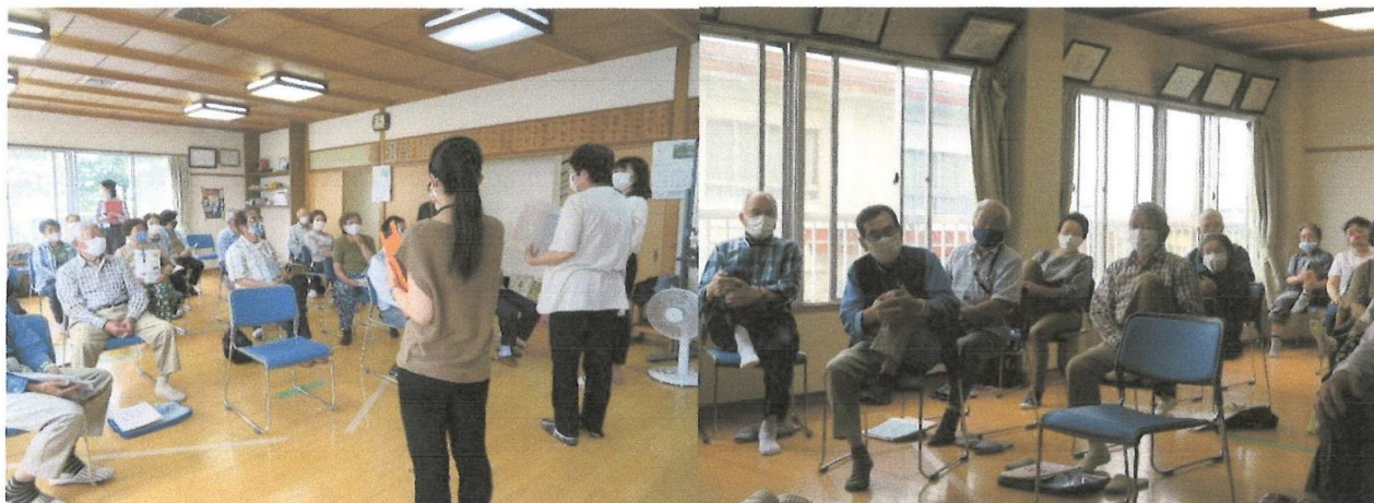
7月1日出張おれんじほっとサロン開催