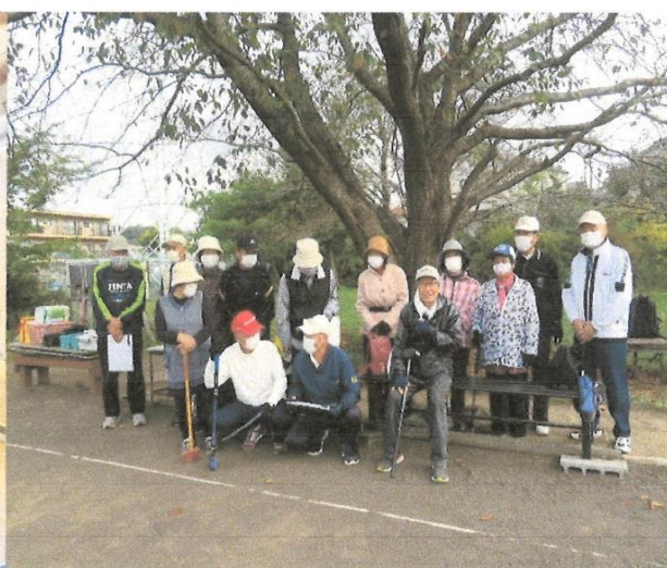
グランドゴルフ大会