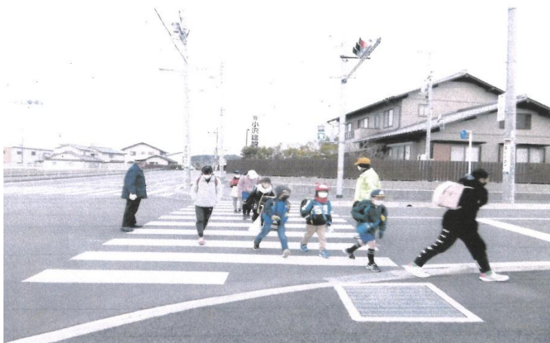
スーパーオオクワ前交差点交通指導の状況