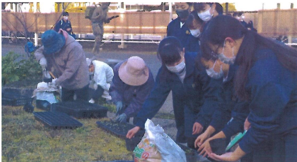
令和3年11月25日 桜が丘中学校