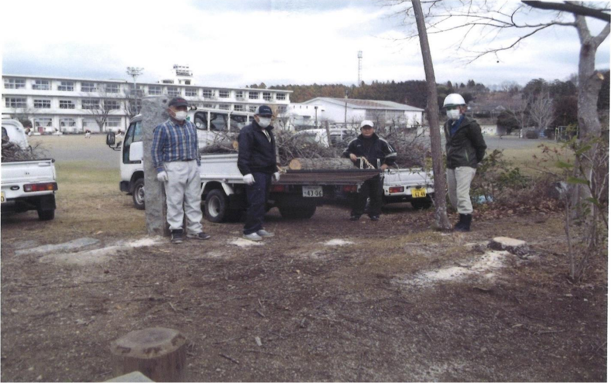
「報徳の森」除伐と高木切り詰め作業