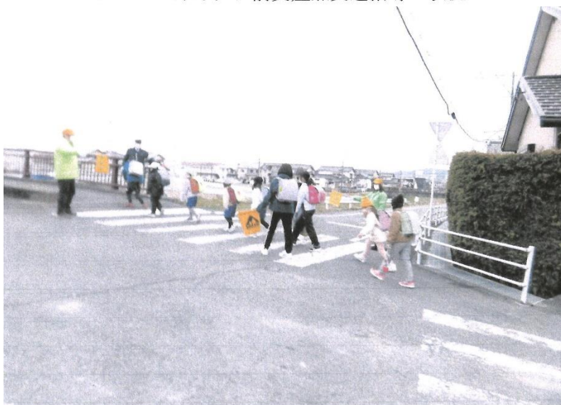
森平公会堂前交差点交通 指導の状況