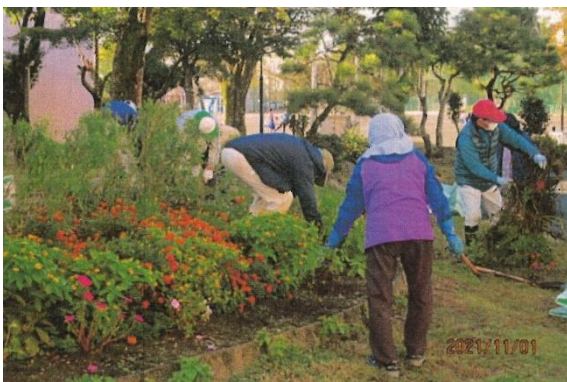
令和3年11月1日 桜木小学校