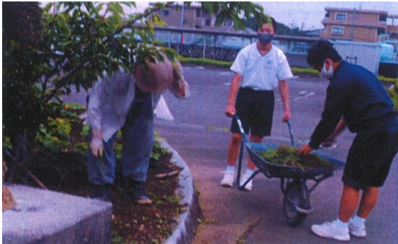
令和3年7月7日 桜が丘中学校