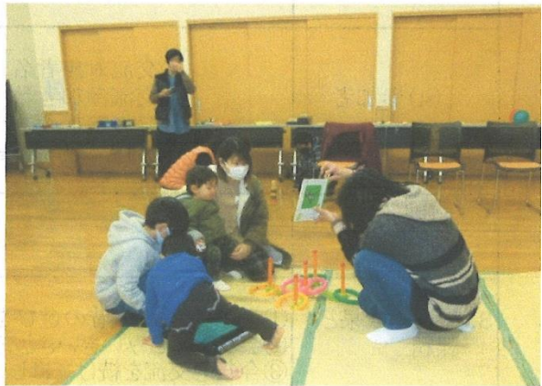
昔話のよみきかせも 子ども保護者、会員が楽 しく耳を傾けた。