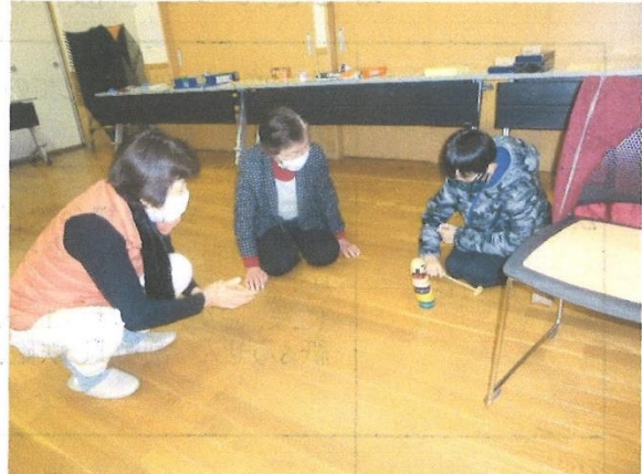
「コマ回し」で楽しむ。ひもで巻くのもできるかな。「だるま落とし」も楽しいね