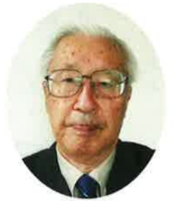
会長からのご挨拶