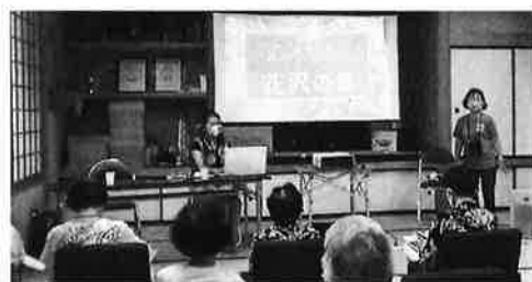
やいづ観光案内人による講座の様子