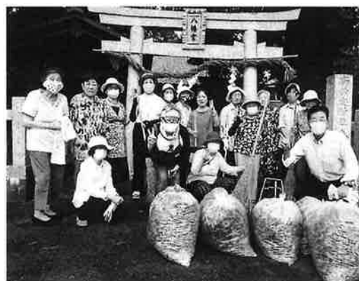
令和2年9月16日の午前9時から、曇り空の下、三右衛門新田にある八幡宮の境内の落ち葉清掃を実施しました。参加者は17名でした。