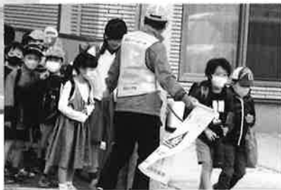
私たちはさわやかクラブやいづの活動を応援しています