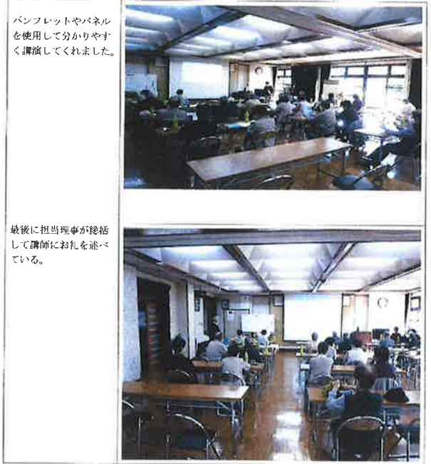
パンフレットやパネルを使用して分かりやすく講演してくれました。