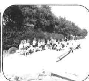
焼いもおいしいね