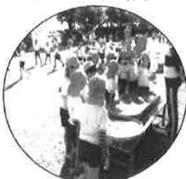
どんぐりコマまわし むつかしいね