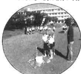
シャボン玉 うまくとんだかな