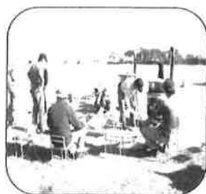
焼いもづくりの様子