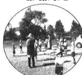
竹トンボもとばしたね