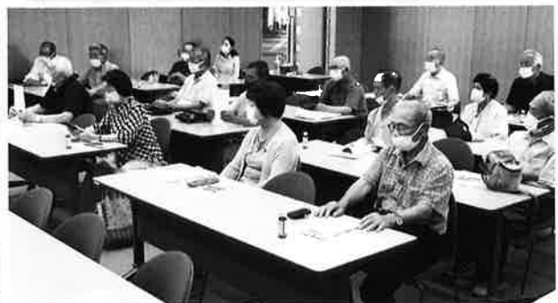
私たちはさわやかクラブやいづの活動を応援しています