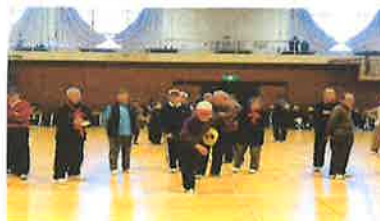
前回の輪投げ大会です。