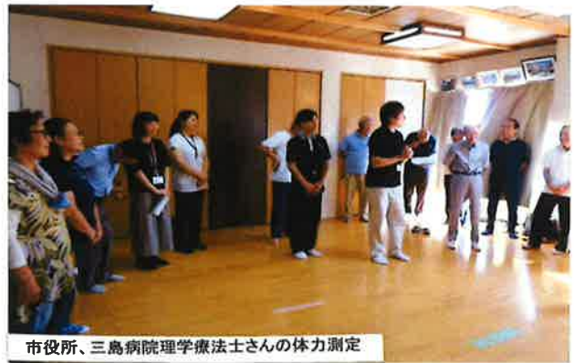
市役所、三島病院理学療法士さんの体力測定