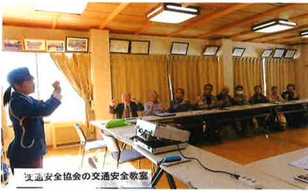
交通安全協会の交通安全教室