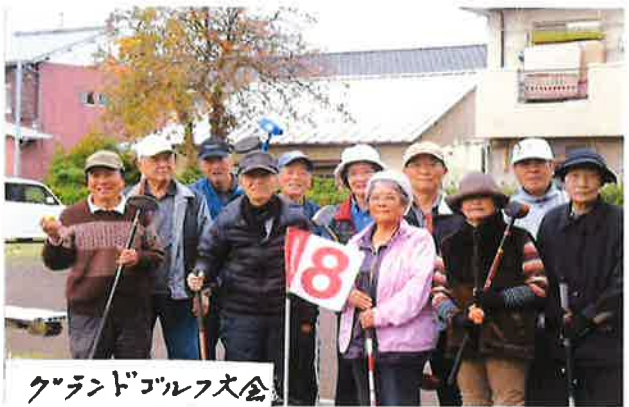
グランドゴルフ大会