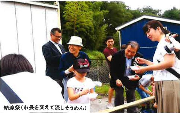
納涼祭(市長を交えて流しそうめん)