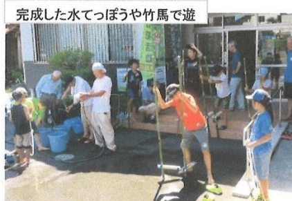
完成した水てっぽうや竹馬で遊

割りばしてっぽうを作って遊ぶ 輪ゴムでこうしてとめる。こがひきがね。こうして輪ゴムをかける。うまく飛ぶかな。