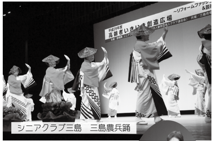
シニアクラブ三島 三島農兵踊