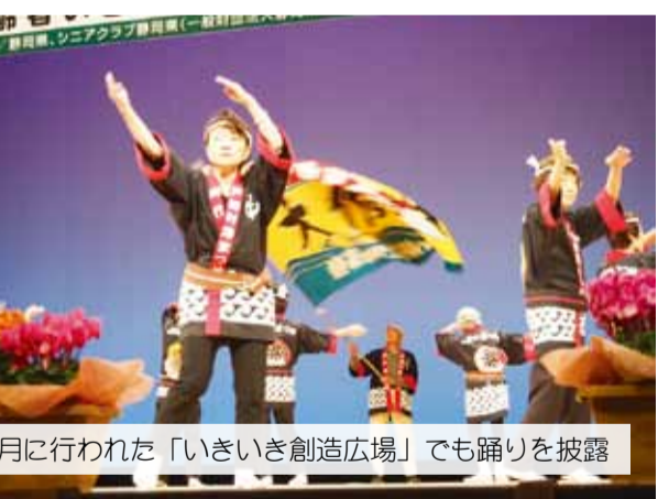
11 月に行われた「いきいき創造広場」でも踊りを披露

グラウンド・ゴルフは、昨年新 たにクラブが発足し 12 名の会員が 集まりました。クラブなどの用具 をそろえ、市大会への参加を目指 し練習をしています。