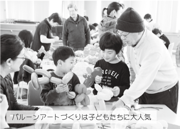
バルーンアートづくりは子どもたちに大人気