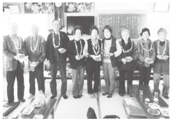
誕生会での記念写真 みんな笑顔でニコリ

互いの近況などを語り合い、また、会員有志によるカラオケや民謡、手品など、時間の許す限り楽しんでいきます。また、毎回11時から始まる誕生会に先立ち、「浪蔵劇団オレオレ詐欺の寸劇」や「大正琴・歌の演奏会」「睡眠時無呼吸症候群の講話」「なつかしの歌謡指導」などを10時から行っています。