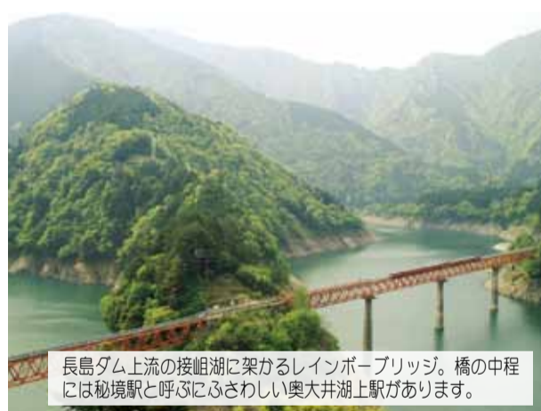
長島ダム上流の接岨湖に架かるレインボーブリッジ。橋の中間には秘境駅と呼ぶにふさわしい奥大井湖上駅があります。

政治は結果がすべてと言われる。しかし、結果が判明する前に、私達は冥土に旅立っているかも知れません。我々世代の責務は、次世代のために、情報の価値を現在のにかつ歴史的に問うことです。情報を正しく理解し分別できる脳力を鍛えて、民主主義社会の権利と義務を正しく行使したいものです。