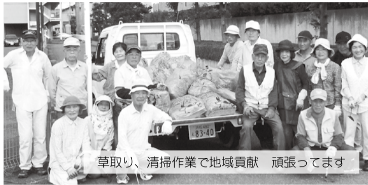
草取り、清掃作業で地域貢献 頑張ってます

地区内の納涼祭や芸能広場にも積極的に参加し、歌(合唱)や踊りの発表、手仕事の作品や園芸の作