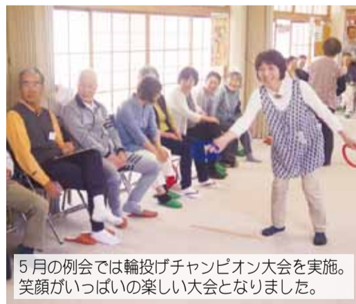
5月の例会では輪投げチャンピオン大会を実施。笑顔がいっぱいの楽しい大会となりました。

さらに今年度から新たに、グ ラウンド・ゴルフ部が発足しま した。道具をそろえ、「仲間とど もに練習をして、県大会にも出 場したい」とみんなの夢は広が ります。活動の幅を広げ魅力的 なクラブのパーク友愛会の活躍 に期待します。