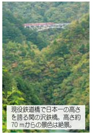
現役鐵道橋で日本一の高さを誇る関の沢鐵橋。高さ約 70 m からの景色は絶景。

平成 26 年には、尾盛駅から閑蔵駅で土砂崩落があり、一部不通となった時期もありました。平成 29 年 3 月に工事が終了し、全線復旧