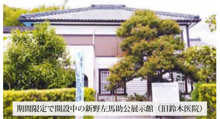
期間限定で開設中の新野左馬助公展示館 (旧鈴木医院)