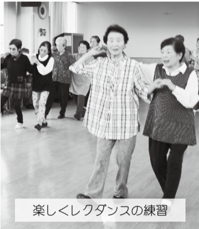
楽しくレクダンスの練習

長泉音頭は郷土芸能としてシニアクラブのPRも兼ねて参加し、イベントを盛り上げています。練習では、頭と身体を動かし、介護予防・健康増進として、休憩時間はサロンとしての楽しく笑顔でおしゃべり交流の場となっています。