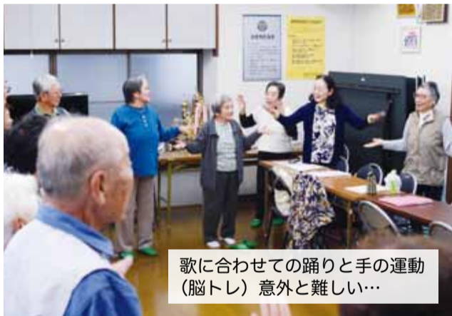
歌に合わせての踊りと手の運動 (脳トレ) 意外と難しい...

活動するようになりました。 会員だけの活動ではなく、自治会と連携し、クラブ未加入の高齢者や子どもたちとの世代を越えたさまざまな交流を行っています。 具体的な活動としては、公会堂で月 1 回行っている「いきいきサロン歌の会」があります。会員以外の人も参加して毎回 25 名程集まり、自治会長も参加をします。ほとんどの方が顔見知りということもあり、和気あいあいとした雰囲気です。