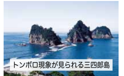
トンボロ現象が見られる三四郎島

白い崖の海岸線が美しい堂ヶ島は、海底火山の噴火に伴いに噴出した白色の軽石や白い火山灰が堆積したもので、その下は黒々とした水底土石流の層で、海流による模様「波の化石」が美しく刻まれ