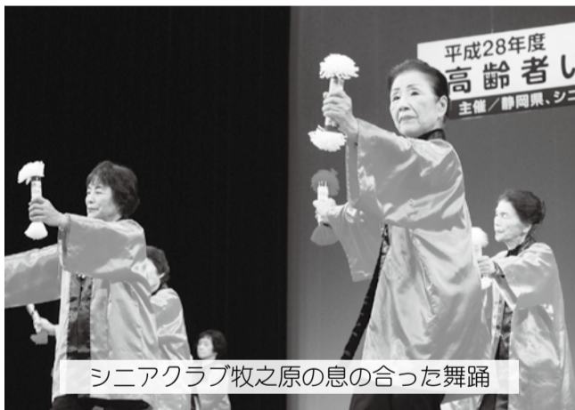
シニアクラブ牧之原の息の合った舞踊

最後にリフォームファッションショー表彰式が行われ、審査員による審査の結果、最優秀賞には越