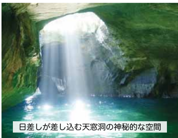
日差しが差し込む天窓洞の神秘的な空間