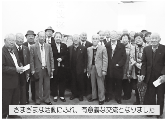
さまざまな活動にふれ、有意義な交流となりました