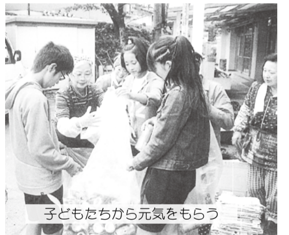
子どもたちから元気をもらう

天候にかかわらず、学校のある日は朝7時ごろから交差点に立ち、交代で見守り活動を行っています。こちらから「おはよう」「行