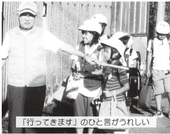
「行ってきます」のひと言がうれしい

3年後には、伊豆市でオリンピックの競輪競技が開催されます。95歳の方が、「それまで頑張る」