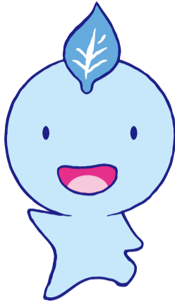
生きがいと健康づくりイメージキャラクター「ちゃっぴー」

介護保険制度は、介護が必要になった方を社会全体で支えようとする制度です。「市町」が保険者となって運営されています。今回は、皆さんに知ってほしい身近な介護保険のサービスを紹介します。