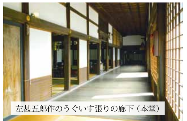
左甚五郎作のうぐいす張りの廊下 (本堂)