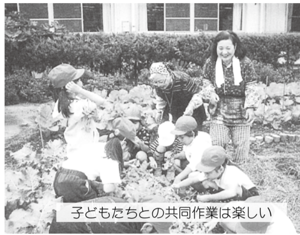
子どもたちとの共同作業は楽しい

が、どこよりも活気があります。普段の活動は、折り紙教室、囲碁、将棋、健康麻雀、カラオケ、お誕生日会、ロコモ体操など、幅広く行っております。また、地域に向けて以下のような活動をしています。