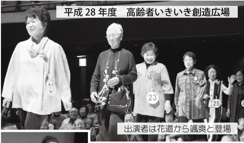
出演者は花道から颯爽と登場

恒例の高齢者いきいき創造広場が、11月15日(水)菊川市の菊川文化会館アエルにて盛大に開催されました。