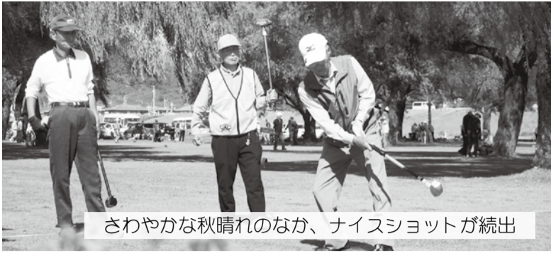
さわやかな秋晴れのなか、ナイスショットが続出