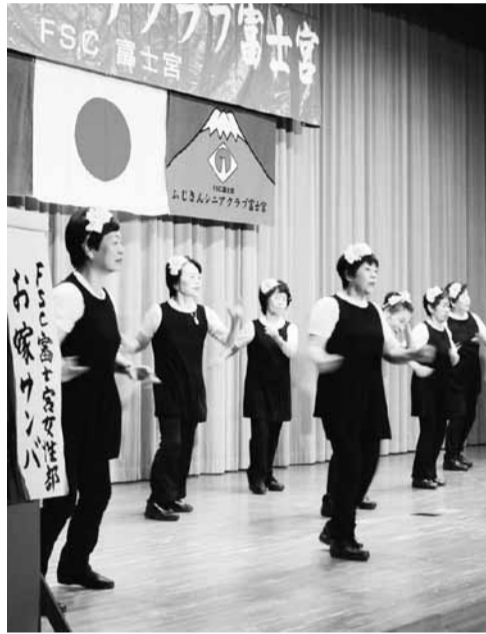
先日行われた文化祭には、会員以外の参加者や来客も多く、地域との結びつきを強く感じることが出来ました

会員から名称を募集をしたところ「シニアクラブ富士宮」が多く、さらに検討を重ねて、富士宮市を象徴するふじさん(富士山)をつけました。これは世界文化遺産登録前のことで、今後、富士山がクローズアップされることを見こ