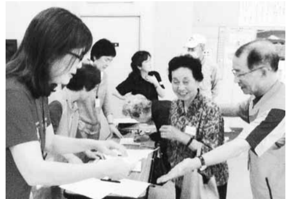
体力測定で自分の状態を確認します

ることに繋がっております。現在ストレッチ体操は全クラブに普及し、広がっております。この運動について大切なことは、会員の理解と協力はもちろんですが、良き指導者を得ることが大事です。この寿会の10年にわたる活動は、会員でもある良き指導者がいたことを付け加えさせていただきます。