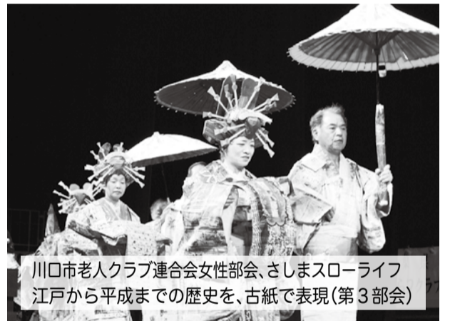
川口市老人クラブ連合会女性部会、さしまスローライフ 江戸から平成までの歴史を、古紙で表現 (第3部会)