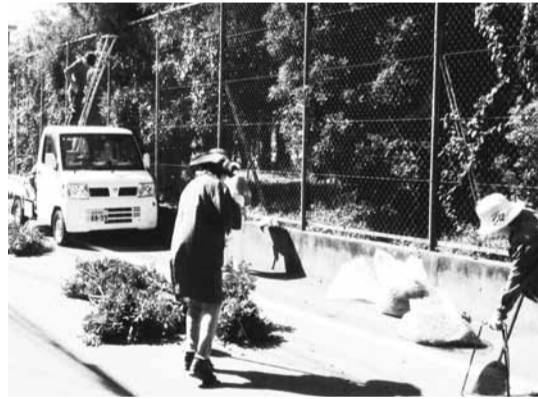
作業には多くの会員が参加してくれます

観光庁登録旅行業304号 日本旅行業協会正会員 (株) ハマカン トラベル TEL 053-478-2000