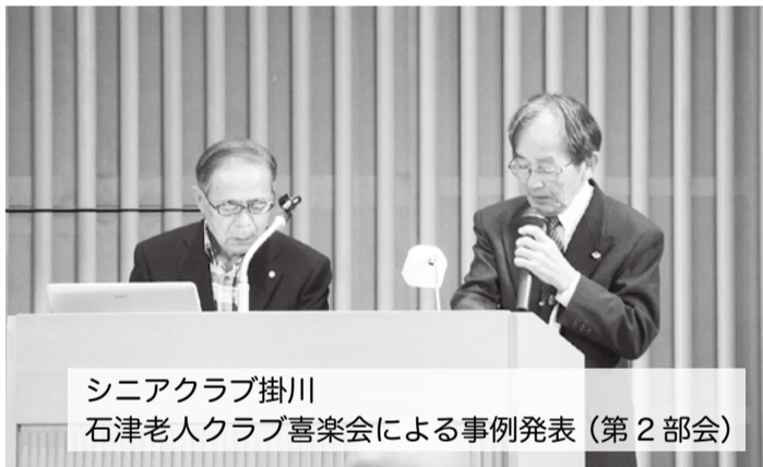
シニアクラブ掛川 石津老人クラブ喜楽会による事例発表 (第 2 部会)