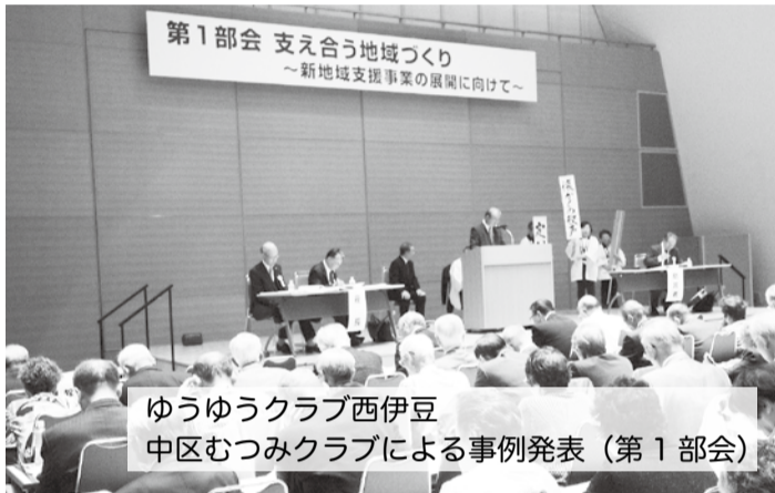
ゆうゆうクラブ西伊豆 中区むつみクラブによる事例発表 (第 1 部会)

第 1 日目は 3 つの活動交流部会が開かれ、 支え合う地域づくり (第 1 部会)、同世代の連帯・ 仲間づくり (第 2 部会)、演じる活動〈舞台発表〉 (第 3 部会) に分かれ、それぞれ発表が行われました。