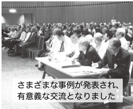
さまざまな事例が発表され、 有意義な交流となりました