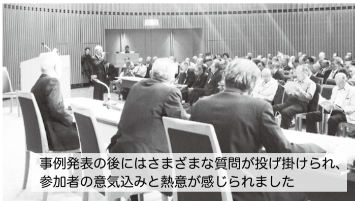
事例発表の後にはさまざまな質問が投げ掛けられ、 参加者の意気込みと熱意が感じられました