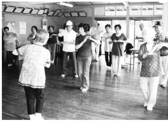
休会クラブとの交流会を実施しています