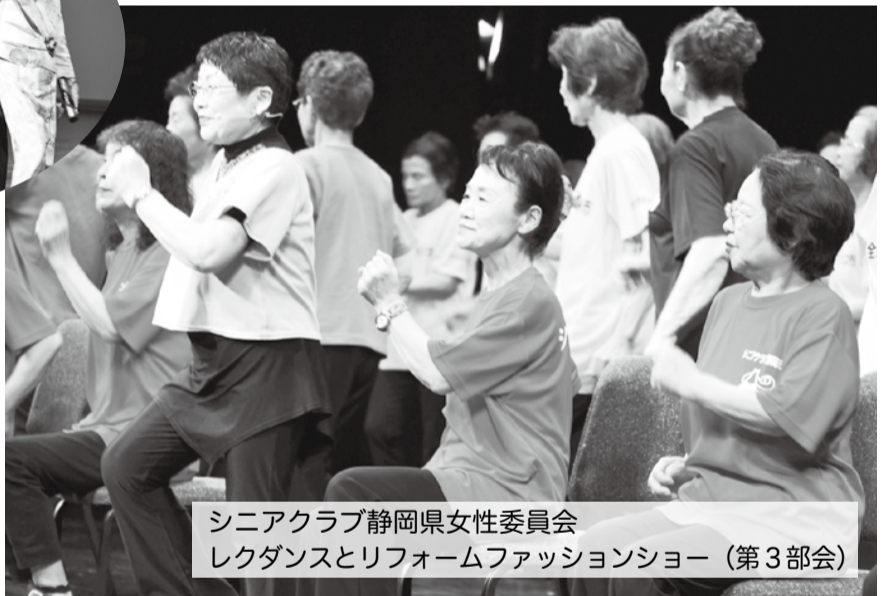
シニアクラブ静岡県女性委員会 レクダンスとリフォームファッションショー (第3部会)