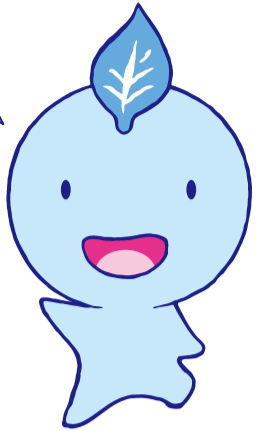
生きがいと健康づくり イメージキャラクター 「ちゃっぴー」

介護保険制度は、介護が必要になった人を社会全体で支えようとする制度であり、「市町」が保険者となって運営されています。 今回は、皆さんが関心の高い介護保険料とサービスの利用方法についての特集です。