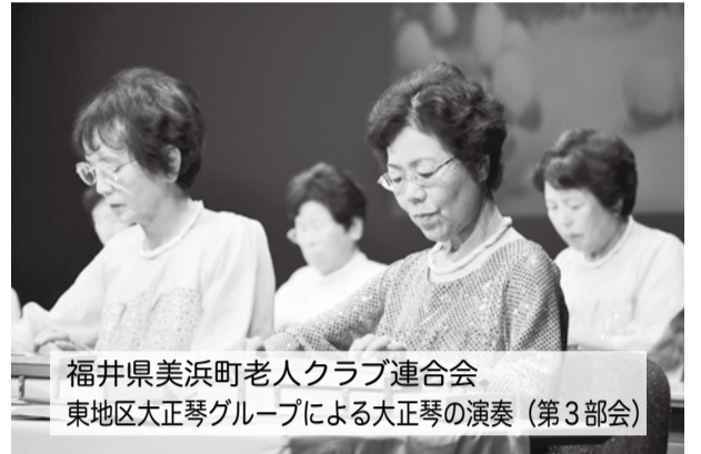
福井県美浜町老人クラブ連合会 東地区大正琴グループによる大正琴の演奏 (第3部会)