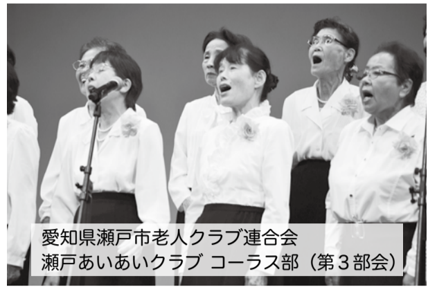
愛知県瀬戸市老人クラブ連合会 瀬戸あいあいクラブ コーラス部 (第3部会)