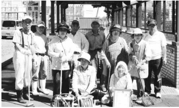
長年の活動が認められ焼津市より環境保全活動団体の登録認定を受けることができました

また昨年の6月には、焼津市より環境保全活動団体として登録認定を受け、認定証を会員のみんなに披露しました。また7月には国