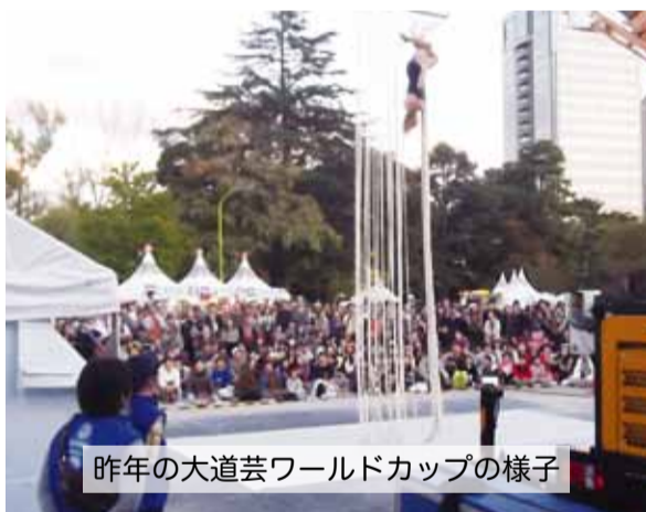
昨年の大道芸ワールドカップの様子

また、昨年10月31日から11月3日までは24回目を迎えた大道芸ワールドカップが開催されました。連日、全国から静岡市へお客様が見え、期間中の4日間で前回を33・5万人上回る181万人の人達で大いに賑わい、やはり駿府城公園は中心的な場所でありました。また、駿府城公園はその昔、確定はしていませんが今川氏の居館があつたと言われており、由緒ある史跡でもあります。ここで駿府城公園に関係する主な歴史を振り返って見ましよう。