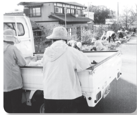
堤防の草取り奉仕作業 みんなで協力して片付け

き、決められた日時に業者に引き 取ってもらいます。これは活動費 の一部となります。 また、春と秋には日帰り旅行も 実施していて、今年にはサクラランポ 狩りを予定しています。地区の夏 祭りには皆さんとの親睦と交流を 深めるためゲームをしたりお酒を 飲んだり楽しい歓談の日もあり ます。また一部の会員ではありません すが、町の環境美化ということで、 堤防の樹木の剪定作業と、除草剤 を散布してくれる方もいます。 私はいつも会員と話をする中 で、「どんなことでもいいから趣