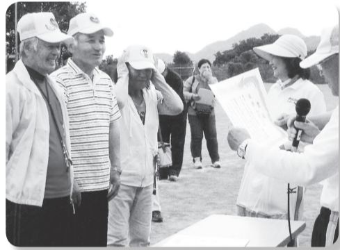
昨年ねんりんピックペタンク大会に 静岡県代表として出場しました

現在函南町には行政区が35あ り、そのうち町老連に加入してい る地区は18あります。半数が休会 解散、未設置となっており、町役 場を通して区長会の席でクラブ加 入の呼びかけをしています。ま た、老人クラブ活動のPR用パン フレットを作成し、ひとりでも多 くの会員加入をとおいさつをし てお願いしてきましたが、未だ効 果はありません。今後も会員加入 促進運動として頑張っていきたい と思います。 ねんりんピックへの出場 平成26年5月に行われた静岡県