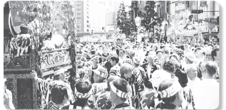
遠州横須賀の祢里 今回東京神田祭 (神田明神遷座400年記念)に参加しました

味を持ち、毎日目標を持って生 活することが健康寿命を延ばす秘 訣だ」と言っております。今後も 会長として会員の皆と共に楽しい 活動を続けていきたいと思いま す。