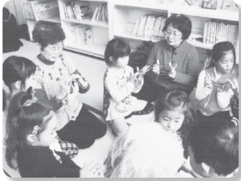
昔の遊び体験で子どもたちとふれあう楽しい時間

また、白銀会の活動としては誕生会を年4回実施し、毎月第一月曜日には輪投げの練習を2時間、3時間程度行っています。その他堤防の草取りなどの清掃作業を年2回行います。また、小学校の下の校時の見守り活動も、役員が交代で信号機の無い交差点に立って月1回行います。その他としては地区の燃えないゴミ収集日に、朝早くから集積所に行き、アルミ缶とスチール缶の選別作業を行い、アルミ缶は網袋に入れ保管してお